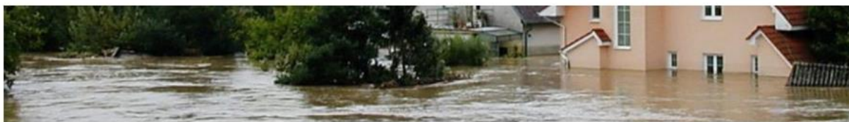
Prevence před povodněmi III / MZe