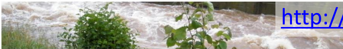
Prevence před povodněmi IV - vybraná opatření / MZe